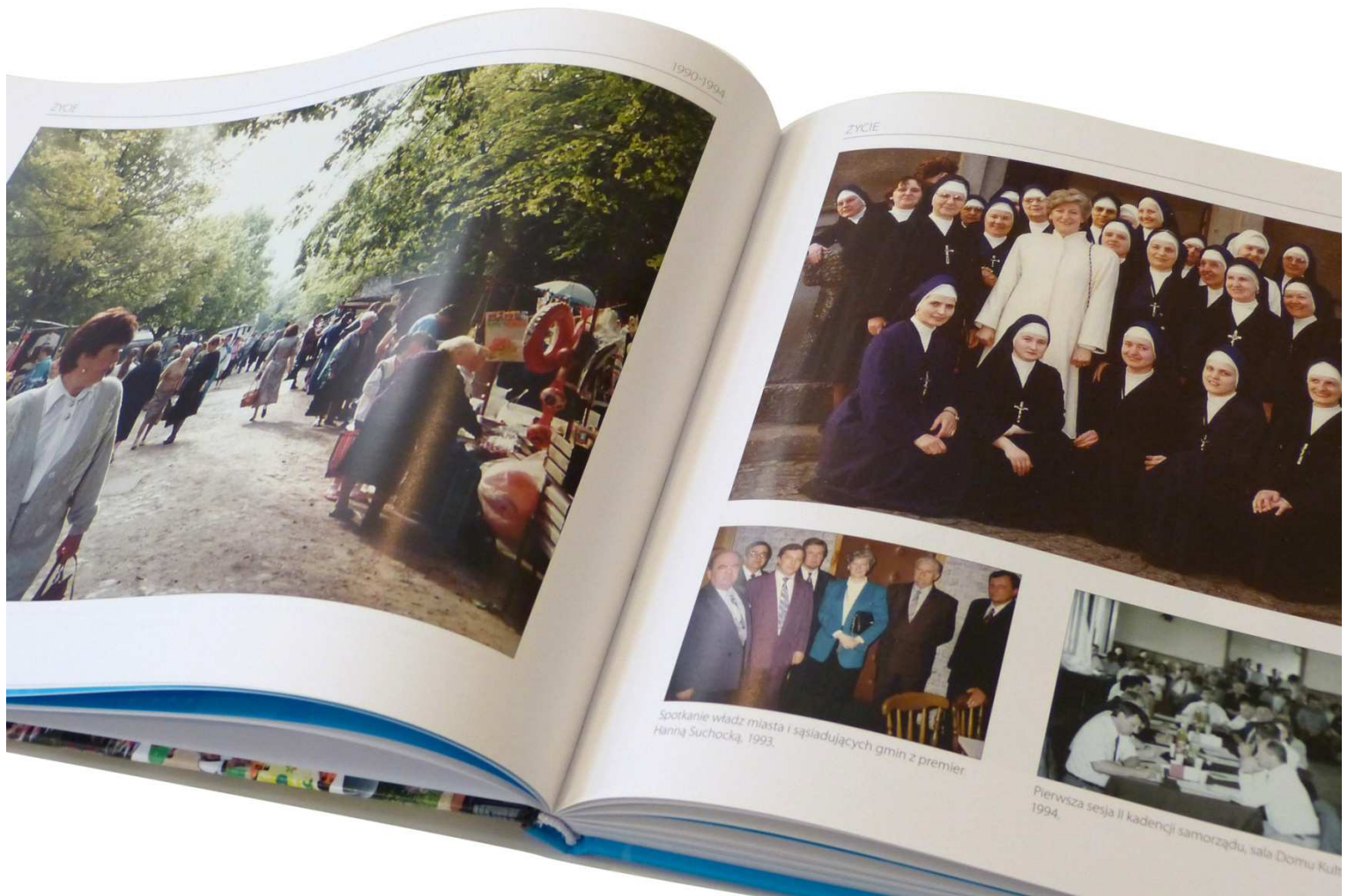
Spotkanie wadz miasta i sąsiedniujacych gmin z premier. Hanią Suchocką, 1993.