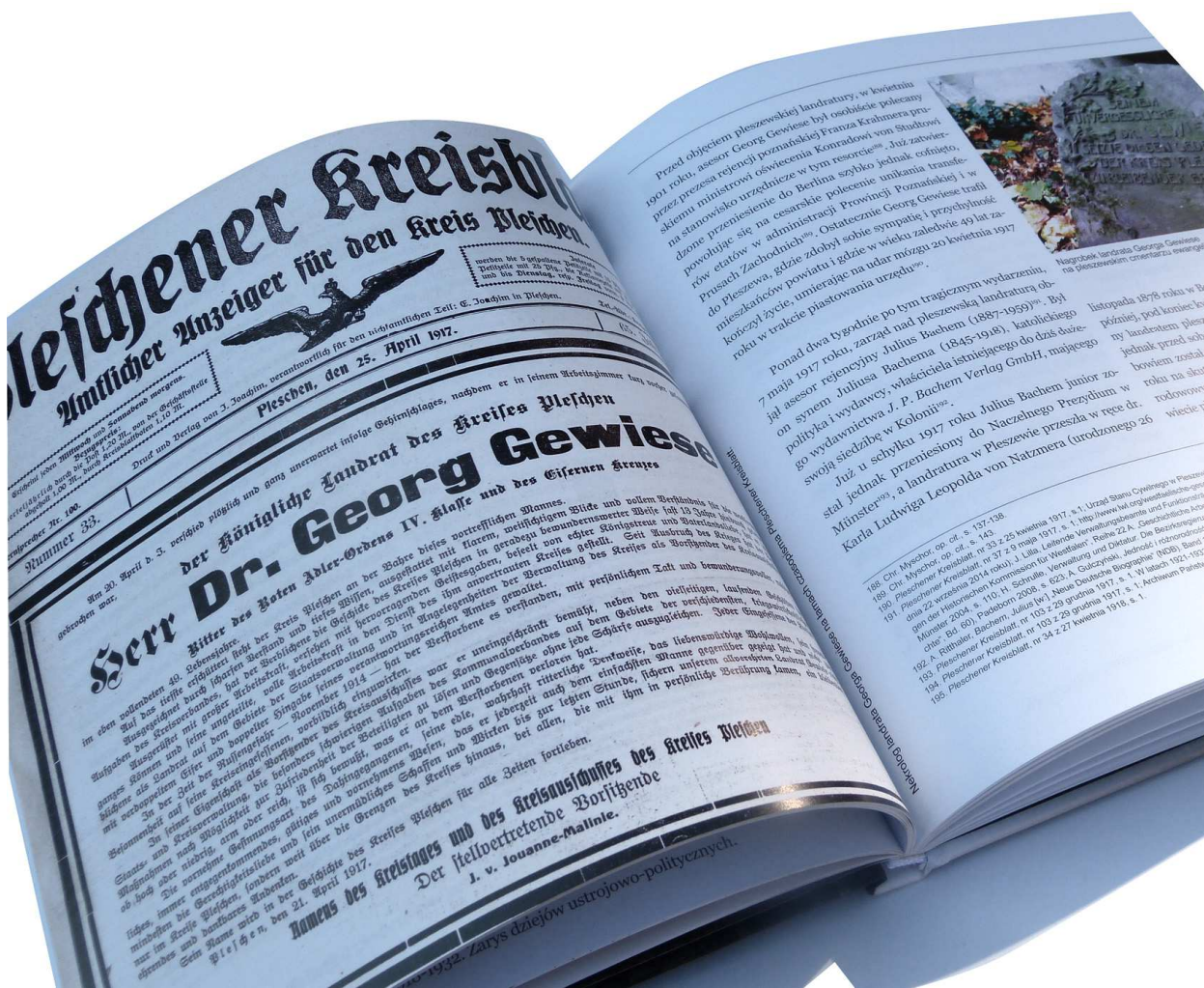
1932. Zarys dziejów ustrojowo-politycznych.