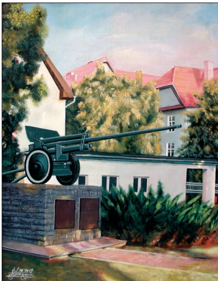
Obraz Andrzeja Wieruszewskiego – „Pomnik ku czci bohaterskim żołnierzom 70 pp i 12 p Strzelców Wielkopolskich oraz Artylerzystów 20 p.panc na tle pleszewskich koszar”.