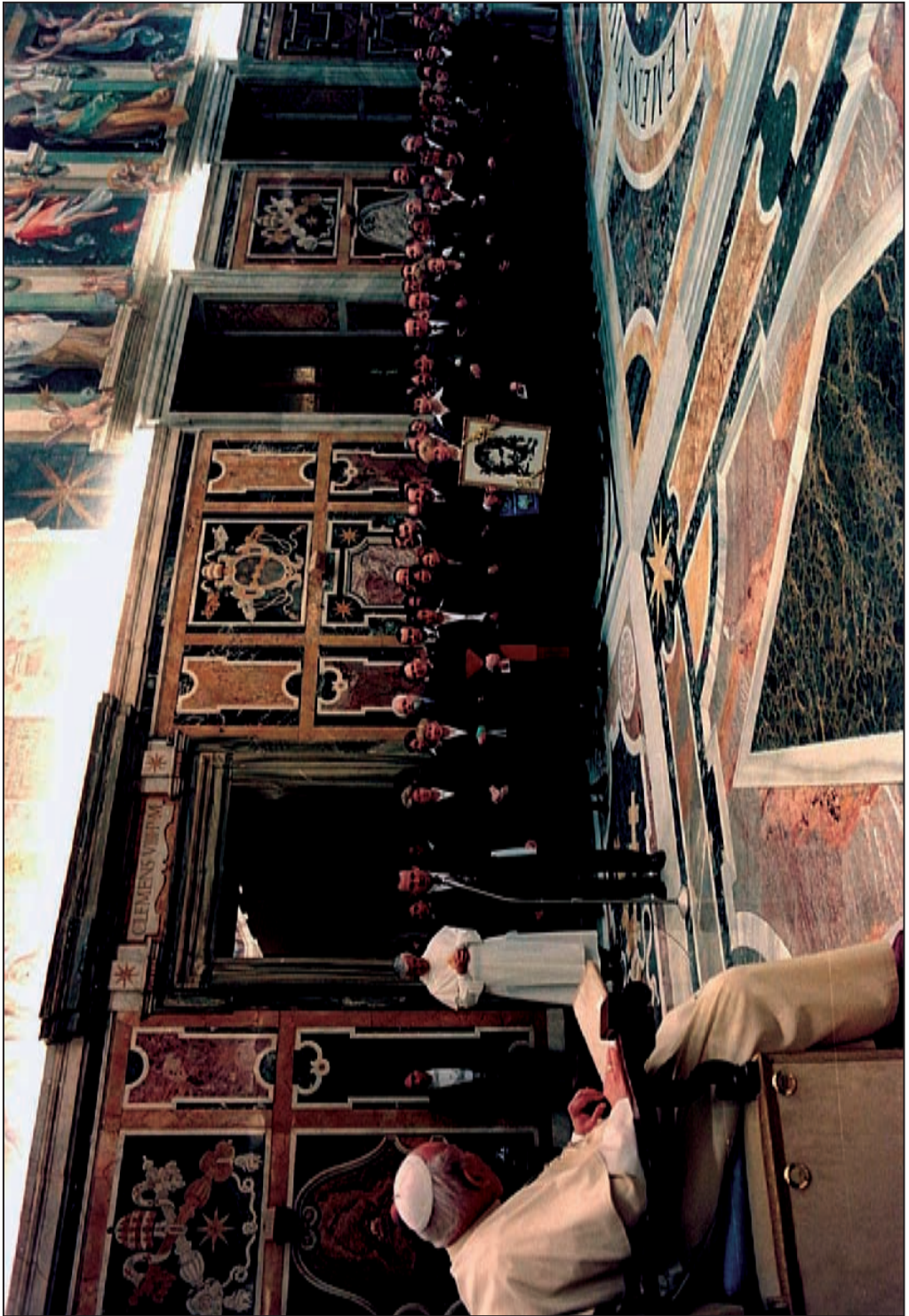
Pleszewscy pielgrzymi na prywatnej audiencji w Sali Klementyńskiej.