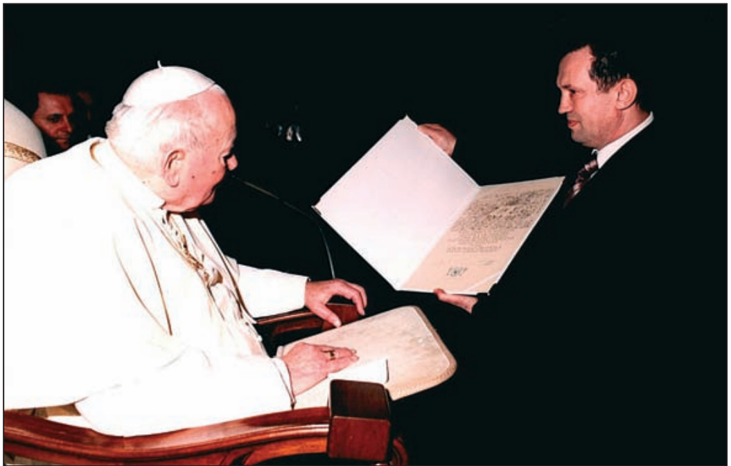
Burmistrz Miasta i Gminy wręcza Ojcu Świętemu Uchwałę Rady Miejskiej nadającą Honorowe Obywatelstwo Miasta Pleszewa