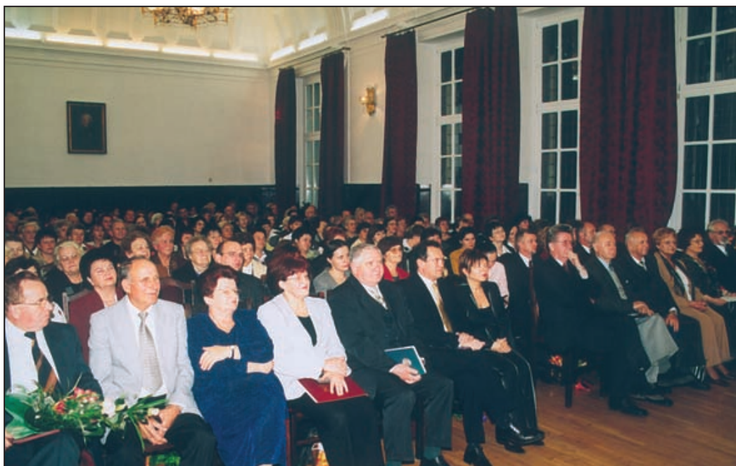
Obchody Jubileuszowe 55-lecia Biblioteki Miejskiej w Pleszewie w auli Liceum Ogólnokształcącego.

E. Szpunt: Nowa siedziba Biblioteki Publicznej w Pleszewie. Rocznik Pleszewski 2000-2001. Pleszew 2002 s.45-47.