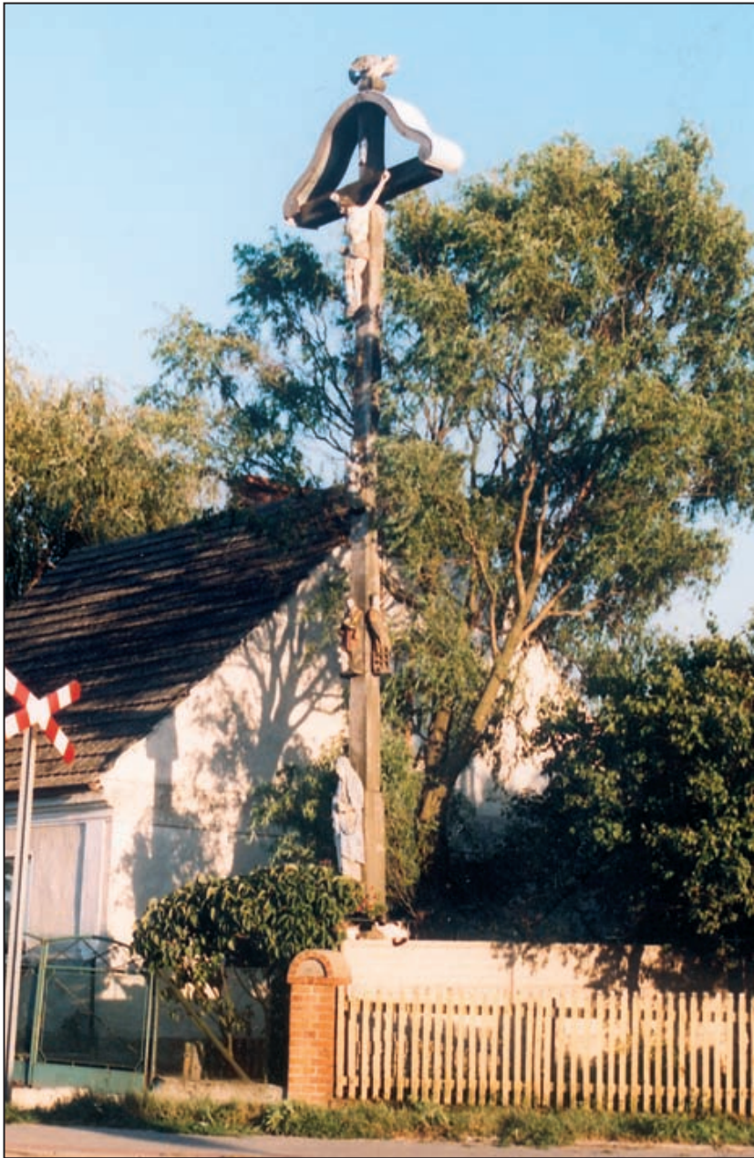
Wielofigurowy krzyż przydrożny w Kowalewie.