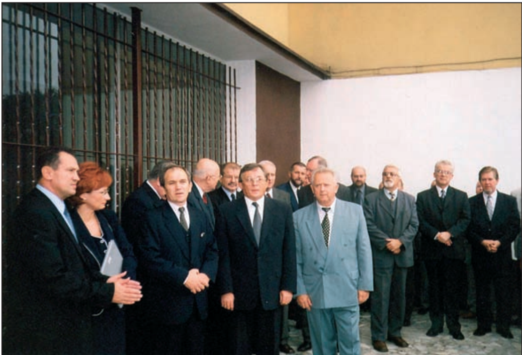
10.10.2001r. Uroczyste Otwarcie Wydziału Ksiąg Wieczystych