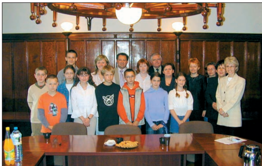
Sala sesyjna pleszewskiego ratusza. 18.06. 2004r. Spotkanie uczestników i organizatorów konkursu „Legenda Ziemi Pleszewskiej” z władzami miasta.