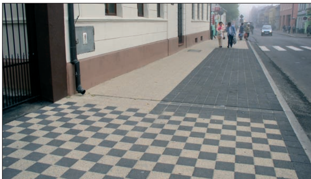
Ulica Poznańska po remoncie. W głębi Muzeum Regionalne z odnowioną elewacją.

Powiat Pleszewski przygotowuje się już do kolejnych inwestycji drogowych. Gotowa jest dokumentacja na przebudowę drogi z Pleszewa do granicy z powiatem krotoszyńskim. Samorząd będzie chciał pozyskać na to zadanie pieniądze z Funduszy Strukturalnych.