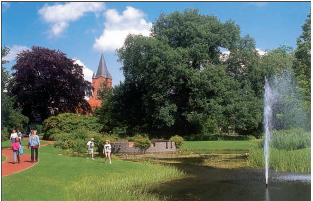
Westerstede - miasto rododendronów.