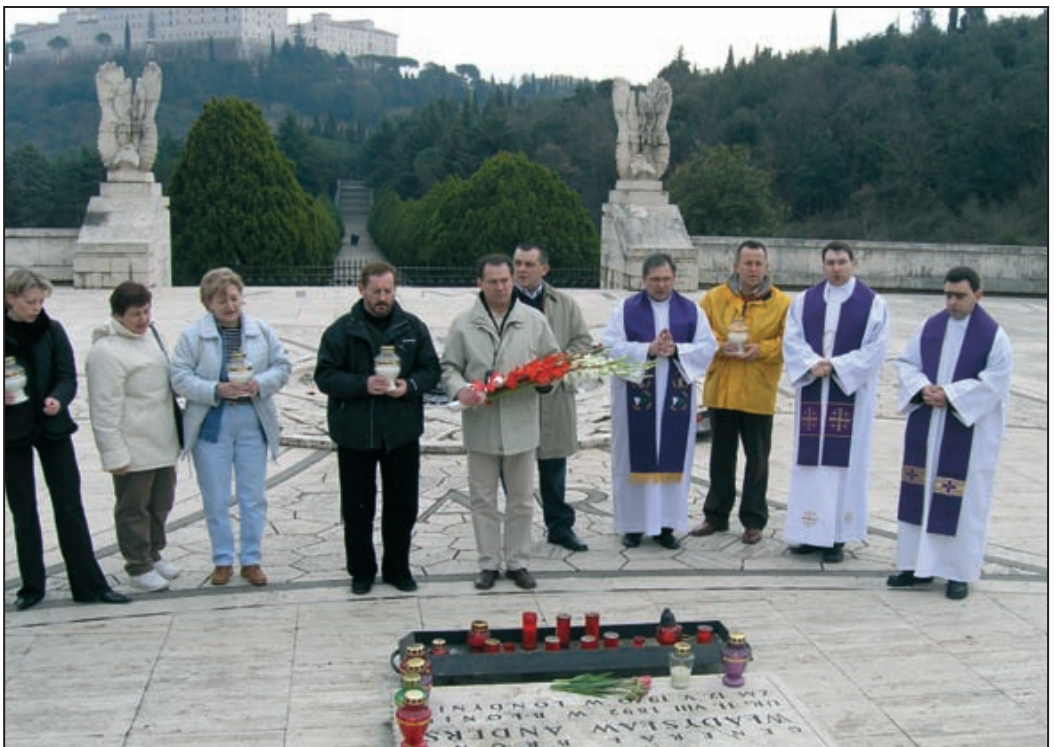
Pielgrzymi przy grobie gen. W. Andersa na Monte Cassino.