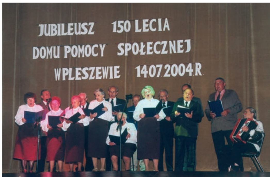
Występ chóru mieszkańców Domu.