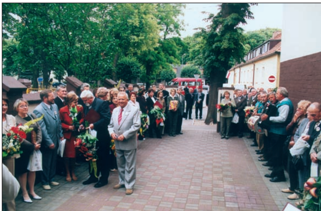
14 lipca 2004 r. W oczekiwaniu na otwarcie sali przy ul. Podgórnej