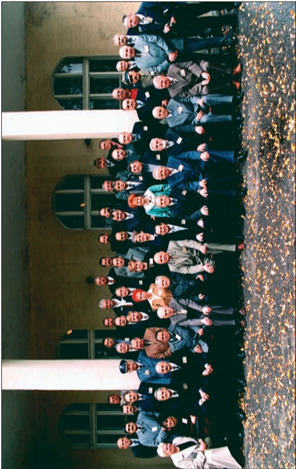
9.10.2004r. Uczestnicy I Koleżeńkiego Zjazdu byłych Żołnierzy i Pracowników Cywilnych 20 pappanc.