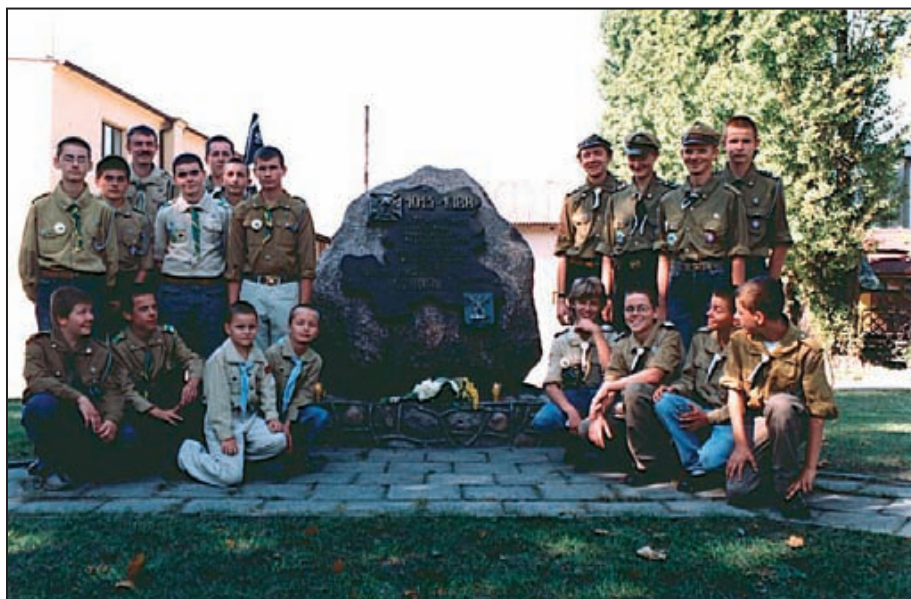
Rok 2003. Reprezentacja drużyn męskich pod obeliskiem ZHP przy Pl. Kościuszki.